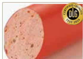
パプリカリヨナー