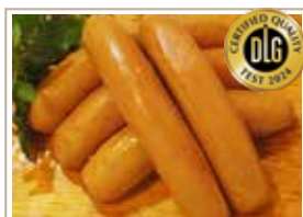
ナチュラルウィンナー