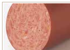
ヤークトブルスト