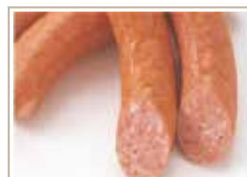
ガーリックチーズ