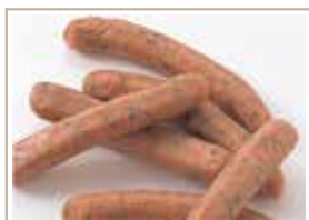
しそ入りウィンナー