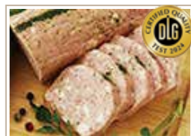
イタリアンケーゼ