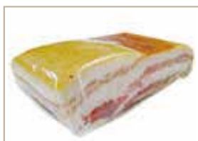
熟成パンチェッタ