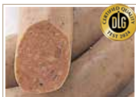
ニュールンベルガー