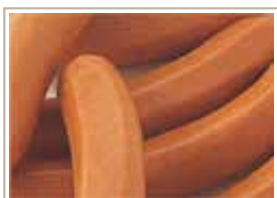
ゲブルツウィンナー