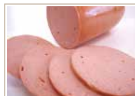
ポークソーセージ