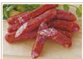
生サラミブルスト